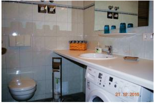
Blick in das Bad.