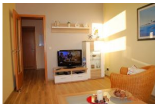
2.Blick in das Wohnzimmer.