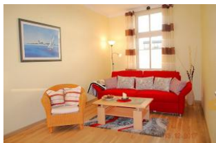
Blick in das Wohnzimmer.

Die Villa Anna ist in erster Reihe direkt an der Strandpromenade gelegen. Das Gebäude wurde aufwändig saniert und ausgestattet. Das Appartement verfügt über einen Wohnraum mit einer Doppelschlafcouch (bequem mit 180 cm x 200 cm), einen Schlafraum mit Doppelbett und eine separate Küche. Das Bad ist mit Badewanne und Duschkabine ausgestattet. Vom großzügigen, südlich ausgerichteten Balkon aus hat man einen Blick über die Ahlbecker Dächer.