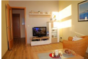
2.Blick in das Wohnzimmer.