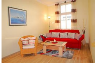
Blick in das Wohnzimmer.

Die Villa Anna ist in erster Reihe direkt an der Strandpromenade gelegen. Das Gebäude wurde aufwändig saniert und ausgestattet. Das Appartement verfügt über einen Wohnraum mit einer Doppelschlafcouch (bequem mit 180 cm x 200 cm), einen Schlafraum mit Doppelbett und eine separate Küche. Das Bad ist mit Badewanne und Duschkabine ausgestattet. Vom großzügigen, südlich ausgerichteten Balkon aus hat man einen Blick über die Ahlbecker Dächer.