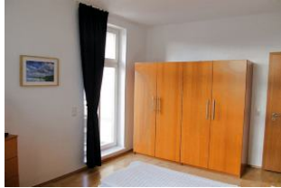
2. Blick in das Schlafzimmer.