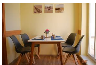
Blick auf den Essbereich.