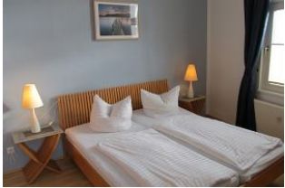
Blick in das Schlafzimmer.