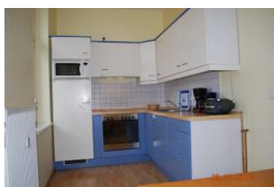
Blick in die Küche.