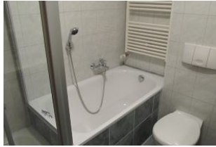
2. Blick in das Bad.