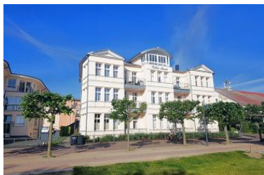
Blick von der Promenade auf die Villa.