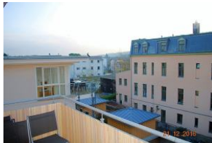
Blick vom Balkon.