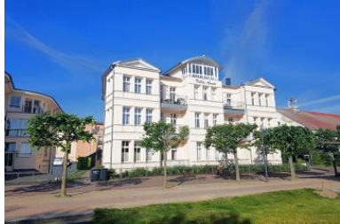
Blick von der Promenade auf die Villa.