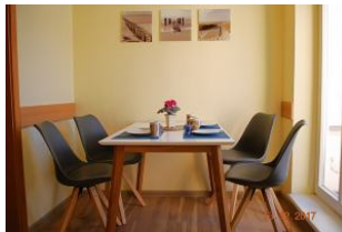
Blick auf den Essbereich.