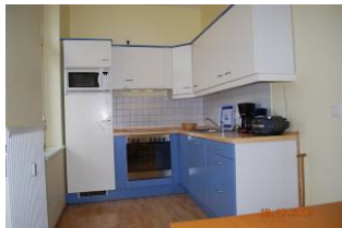
Blick in die Küche.