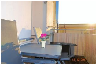
Blick auf den Balkon.