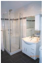
Im Bad steht Ihnen jetzt auch eine Waschmaschine zur Verfügung.