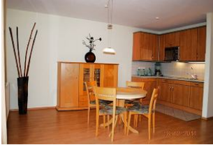
Blick auf den Ess- und Küchenbereich.