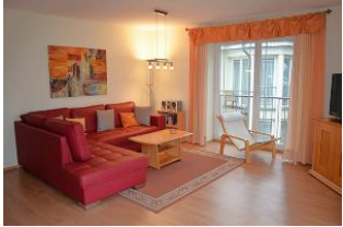
Blick auf die Sitzecke.