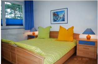
Blick in den Schlafraum.