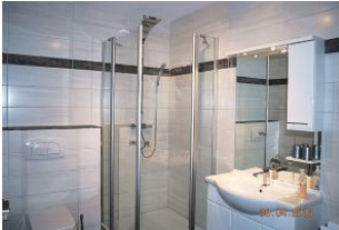
Blick in das 2015 komplett neugestaltete Bad.