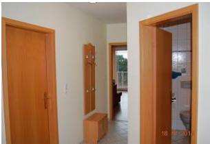
Blick von der Eingangstür in den Flur